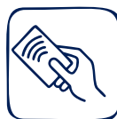
Tarjeta de Proximidad