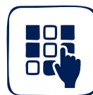
Código de Acceso