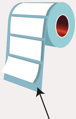
Con papel base